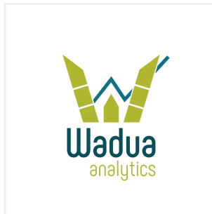
Variar la proporción de los elementos del logotipo

Esta es una pequeña guía con algunos usos incorrectos que deben evitarse.