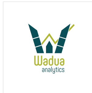
Cambiar su esquema autorizado de color