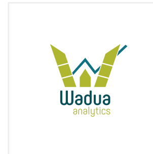
Estirar el logotipo vertical u horizontalmente