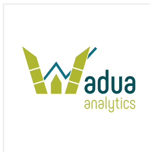
Utilizar el símbolo "W" como parte de un texto o como un complemento editorial