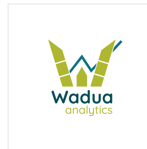
Recrear el logotipo utilizando otra tipografía