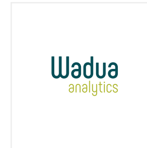
Utilizar la tipografía a manera de logo, sin el apoyo del símbolo