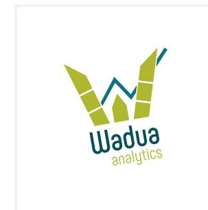
Aplicar la marca rotada